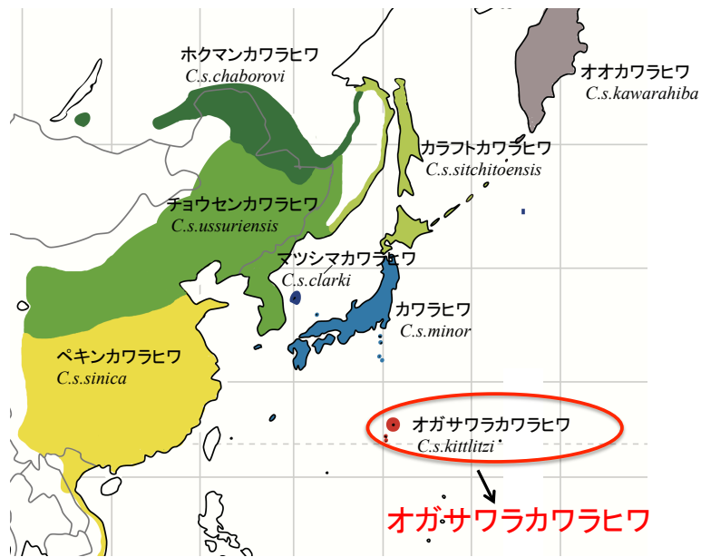
図 1. カワラヒワの亜種の繁殖分布域の分布図