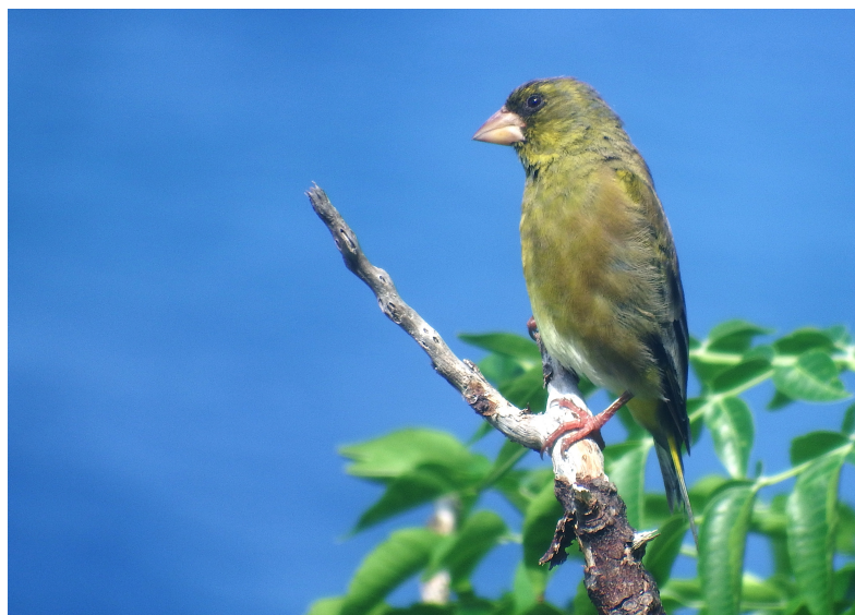
図 2. オガサワラカワラヒワ (オス成鳥)