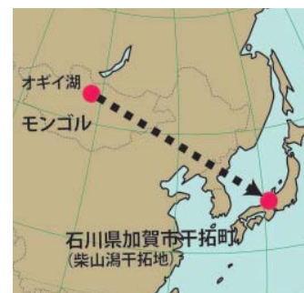
今回判明したタゲリの移動

カラーフラッグは、鳥の足に装着する足環の一種で、鳥に負担にならない範囲で、人間が野外で観察したときに目立つように「旗」状に設計されています。足環で野鳥の移動経路などを調べる「鳥類標識調査」の一環として、研究機関などの国際的な協力体制によって、調査場所別に装着位置や色、形を決めて実施されています。観察するだけでその鳥がどこで足環をつけられたのかが分かる仕組みです。