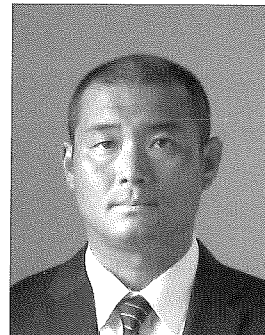
日本イヌワシ研究会会長